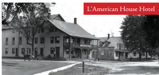
L'American House Hotel

Cette charmante bâtisse de style hollandais (Dutch) fait maintenant partie du Musée Missisquoi. Depuis 2012 le visiteur bénéficie des atouts d'une muséologie moderne. Construit en 1840, cet ancien magasin général a cessé ses activités en 1958. Comme tout magasin général, le lieu remplissait de multiples fonctions : en plus d'offrir une diversité étonnante de produits dont des médicaments (opium et morphine), il logeait le bureau de poste et offrait autour de son poêle à bois l'occasion d'échanger les nouvelles.