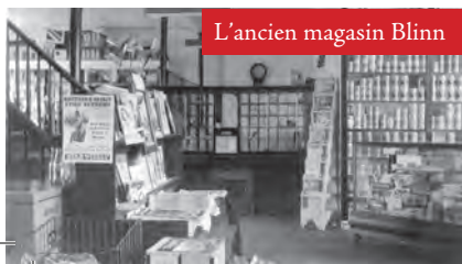
L'ancien magasin Blinn