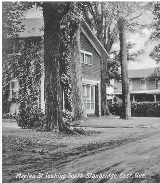
The Cecil House (now Old Mill Hotel)

Sur le terrain au bord de la rivière un monument rend hommage aux pionniers du village. Le site créé en 1993 se situe à l'emplacement de la tannerie Welch, détruite en 1896.