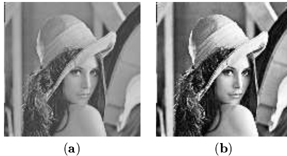
FIG. 1 – (a) Image originale lenna.pgm . (b) Image lenna après égalisation d'histogramme.

(b) Appliquer à nouveau (une deuxième fois) la technique d'égalisation d'histogramme sur l'image obtenue précédemment. Y-a-t'il un changement ? Pourquoi ?