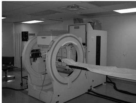
FIG. 1 – Image d'un tomographe.

L'objet de ce TP est de réaliser dans un premier temps la simulation d'un tomographe axiale (cf. Figure 1) puis dans un deuxième temps de retrouver l'image originale par reconstruction tomographique. La tomographie se rencontre en particulier en médecine où on doit retrouver une tranche (i.e., une image) d'un organe (le cerveau par exemple) à partir de ses projections obtenues par Rayons-X. On utilise une approche semblable en mécanique et métallurgie pour effectuer des essais non-destructifs (i.e., sans aucun contact avec la pièce à étudier) ou encore en géologie et géophysique pour étudier les différentes couches géologiques d'un terrain etc.